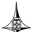
TABELA DE USOS E ATIVIDADES PERMITIDOS