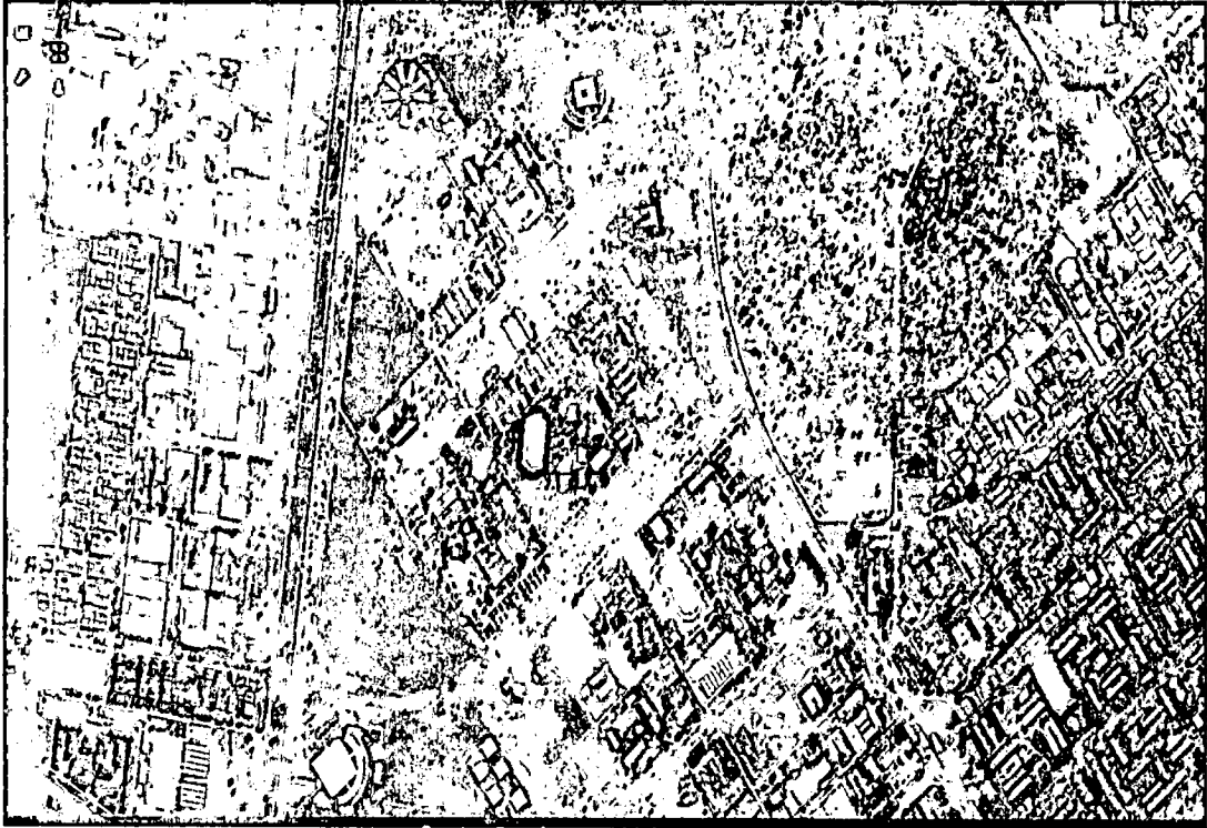
Fonte: Anexo III – Quadro 5A – Parmetros de Ocupao do Solo/ Regio Administrativa do Guar – RA X.