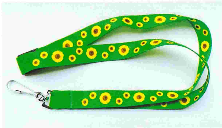
cordao de girassol

As medidas de segurança nos aeroportos são muito rígidas. Mas aqueles que trabalham nesses estabelecimentos geralmente conhecem os trâmites burocráticos e sabem o que é possível fazer para facilitar a vida de passageiros com necessidades especiais, como pessoas com problemas de saúde e idosos com dificuldade de locomoção. Nesse sentido, uma história mostra que, com medidas simples e bom senso, é possível ajudar essas pessoas em ambientes movimentados e que geram tensões e nervosismo, como é o caso dos aeroportos.